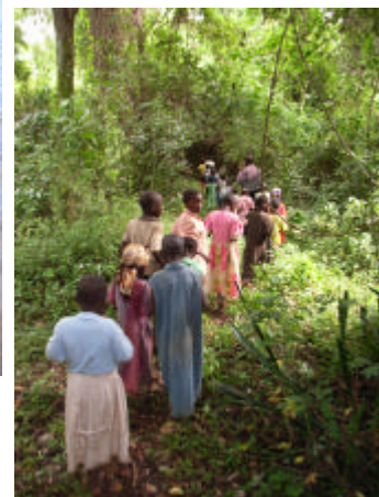
Accompagner l'enfant dans la découverte de son environnement est une mission que le Centre MARAFIKI WA MAZINGIRA s'est assignée.

MARAFIKI WA MAZINGIRA se présente comme d'abord comme un espace de rencontre et d'échanges pour enfants dans la promotion des groupes solidaires pour la défense de la nature, et par la suite comme un cadre éducatif, regroupant des enfants au sein des activités d'Education environnementale en vue de cultiver en eux le sens de curiosité scientifique, de responsabilité citoyenne vis-à-vis de l'utilisation et la gestion des ressources naturelles locales, le respect de la création et des lois naturelles qui gèrent notre Planète et aussi de développer chez les enfants les attitudes positives vis-à-vis des autres personnes humaines.